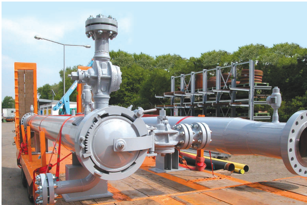
Mobile Molchscheule im Einsatz